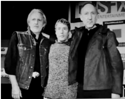
John Entwistle (til vinstri), ásamt Roger Daltrey og Pete Townshend.

Gert til gamans og vonandi einnig fróðleiks. Kveðja: KRF