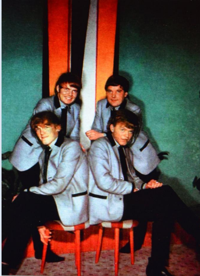
Vel viðeigandi er að enda þessa samantekt á ljósmynd af bítlahljómsveitinni Hljómum frá Keflavík sem tekin var í janúar árið 1965.

Gert 4 september 2015 til gamans og vonandi einnig lítilsháttar fróðleiks. Kveðja: KRF,