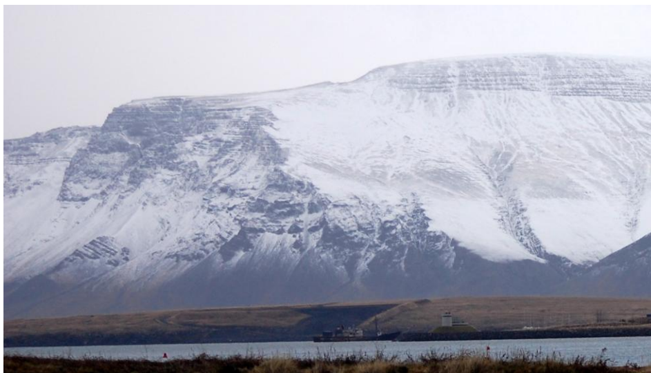
Esjan byrjuð að sanka að sér snjó.