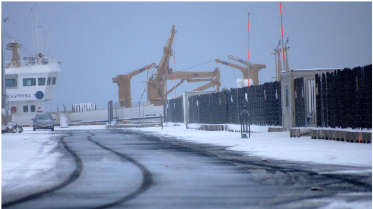
Sundahöfn í Reykjavík 2011