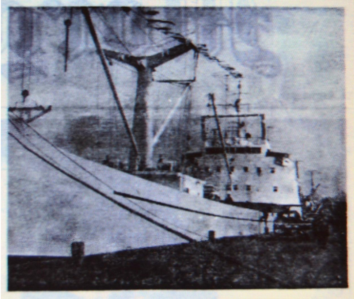
Glæsilegt skip og 2500 tonn að stærð.

Hvort Hofsjöklarnir voru aðeins tveir í rekstri hér við land veit höfundur ekki en veit þó að 12 júní 1964 sigldi 2500 tonna frystiskip inn í Reykjavíkur höfn fánum prýtt stafna á milli undir þessu nafni Hofsjökull, og er ekki sama skip og hitt sem nefnt var. Enda talsvert minna skip heldur en hinn Hofsjökull, muni höfundur rétt.