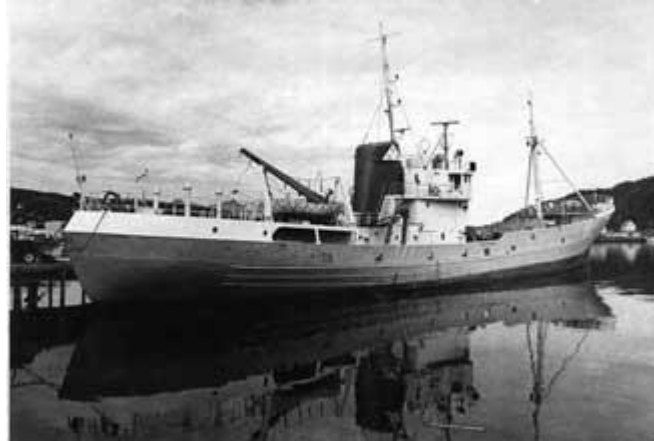
Maí GK 346 komin til Noregs

Það þótti vel við eigandi að fá Halldór Halldórsson til að sigla skipinu yfir til Noregs þar sem nýir eigendur tóku við því til síns brúks.