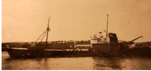
Maí GK 346

12 dögum eftir að landfestar voru leystar kom skipið til hafnar í Hafnarfriði með 585 tonn, eins og áður segir. Þessi mynd er reyndar ekki frá þeim viðburði heldur tekin við annað tækifæri