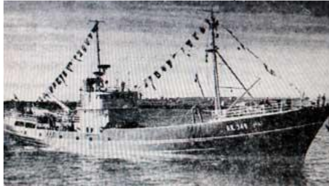
Maí GK 346

18 maí 1960 kom togarinn Maí GK 346 í fyrsta sinn inn til Hafnarfjarðar. Fánar voru strengdir í afturmastrið og frá brú í formastrið og þaðan fram á bakka.