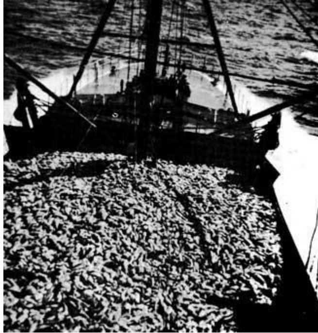
Maí GK 346 Úr stóra túrnum 1967

Þótt vel veiddist var samt reynt að vera með trollið í botni eins mikið og hægt var og hvergi slegið af. Mannskapurinn hefur sem sjá má þurft að taka hraustlega til hendinni til að ekki þyrfti að láta flatreka á meðan aflanum væri komið fyrir. Hér lagar skipstjórinn sig til á bleyðunni áður en trollinu er kastað.