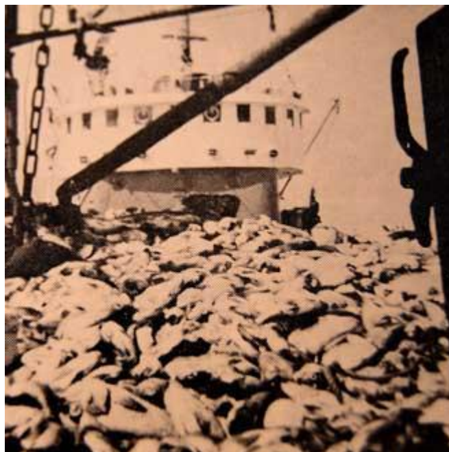
Maí GK 346 Úr stóra túrnum