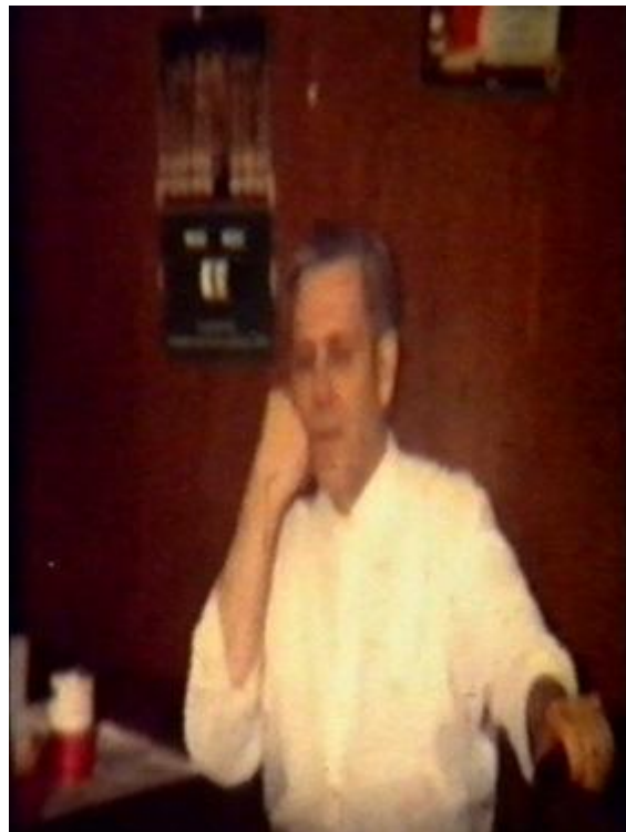
Addi 2 kokkur slakar á eftir uppvask og frágang í borðsalnum.