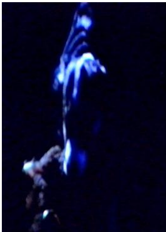
Skipshundurinn Bjössi (Fékk nafn af leigubílstjóra í Hafnarfirði)