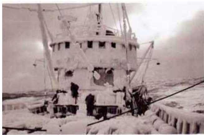
Maí GK 346. Myndin er tekin 1968.

Myndin er úr bókinni “ Mennirnir í brúnni. “