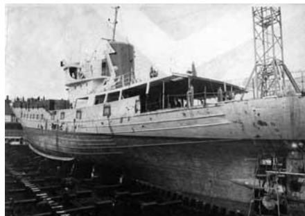
Maí GK 346

Eftir að til Noregs kom voru gerðar töluverðar breytingar á skipinu og flest sem áður minnti á togara fjarlæggt. Sjá má að gálgarnir eru horfnir og sömuleiðis pokabómurnar í formastrinu.