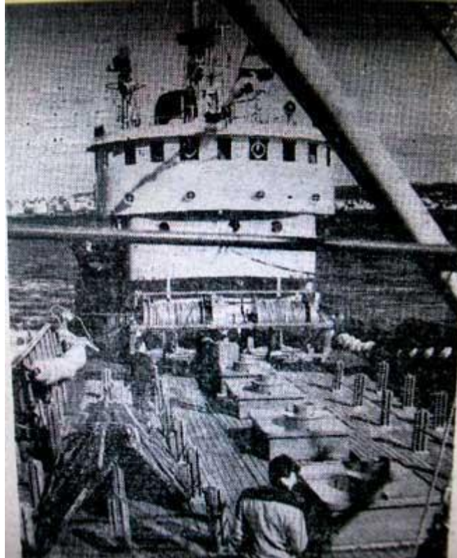
Maí GK 346

Maí kemur inn til Hafnarfjarðar úr sínum fyrsta túr.