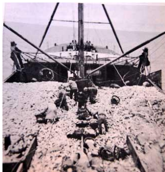
Maí GK 346 Úr stóra túrnum 1967

Myndin er úr bókinni " Mennirnir í brúnni "- sem út kom 1970