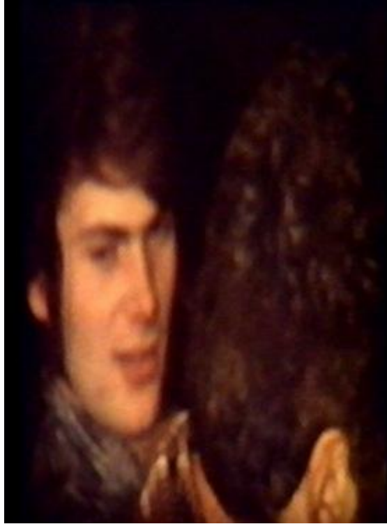
Dúlli í Brekku háseti. (Set þetta nafn með af þeirri ástæðu að þekkja ekki annað)