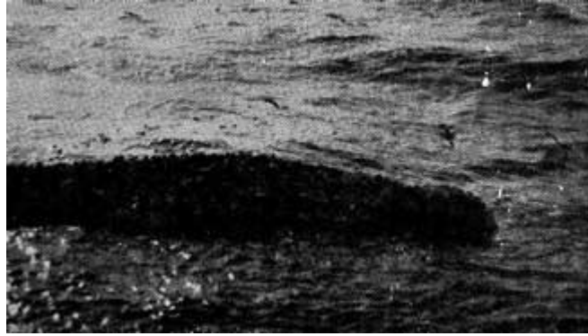
Maí GK 346 Úr stóra túrnum

Á vordögum 1967 setti Maí vel í hann við austur Grænland og fyllti skipstjórinn skipið og tók túrinn 12 daga.