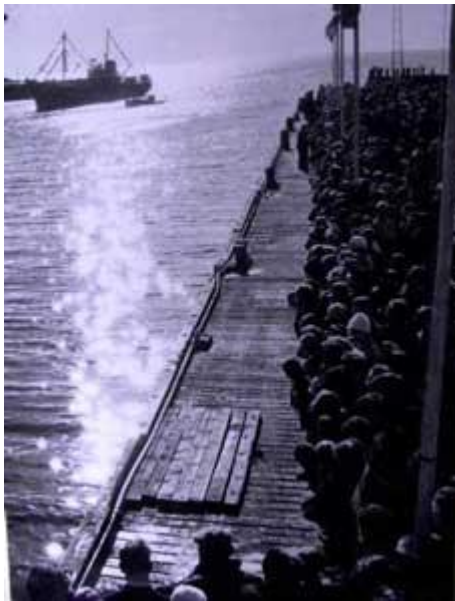
Maí GK 346 18 maí 1960

Mikill mannfjöldi tók á móti þessu miklu skipi eins og sést vel á þessari mynd.