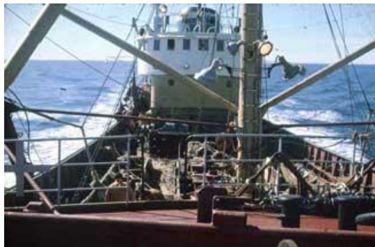
Maí GK 346

Mörg skip hafa lotið í lægra haldi fyrir ísskáninni sem vill safnast utan á þau í frostum.