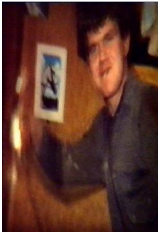
Gummi var háseti í þessum beit túrum.