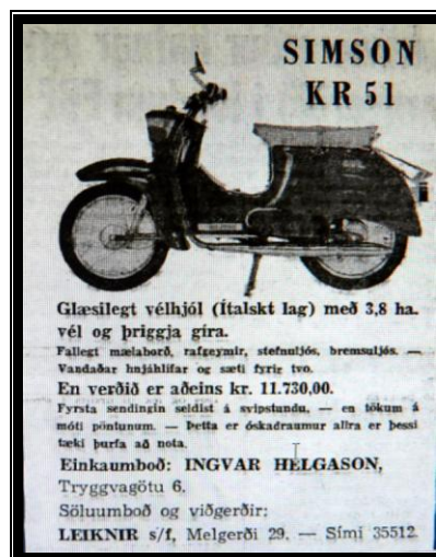
Simson með vespulagi.

Hjólið er þriggja gíra og öllu veglegra en hitt. Auglýsing í Þjóðviljanum í apríl 1964