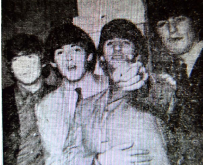
The Beatles. 12 ágúst 1970.