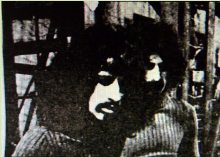
Ringo Starr í hlutverki Frank Zappa í myndinni „200 Motels“.

Eins og flestir vita að þá fjallar kvikmyndin Le It Be um vinnu og verk The Beatles sem 1969 hafa gersamlega lagt heiminn að fótum sér með hundruð milljóna aðdáendaskara sem vilja vita allt um þessa menn og þreytast ekki á að afla sér allra upplýsinga sem mögulegt er að gera. Bíómyndin leyfir okkur, aðdáendum, að skyggjast svolítið á bak við tjöldin og sýnir okkur líka vel hvernig ein hljómsveit, rokkhljómsveit, í raun og veru hættir. Let It Be er því stórvirki. Heilmikið hugrekki þarf til að vilja opinbera veikleika sína eins og sumpart er gert í þessari kvikmynd og vera undir smásjá myndavélaaugans sem sýnir allt sem fyrir þetta auga ber. Munum að vel var hægt að taka ákvörðun um að eyða þessu efni en var ekki gert og bendir til heiðarleika aðilanna sem að stóðu. Öllum má ljóst vera sem horfa á að neistinn sem einkenndi starf The Beatles á til að mynda upphafsárunum og á fyrstu fjórum plötum sveitarinnar þar sem spilamennskan og leikgleðin einkennir hvern tón að allt þetta er horfið og vikið fyrir setningum á borð við: " Hvort ég verði að mæta? Hvort að verði að taka þetta aftur upp " - og öðrum álíka.