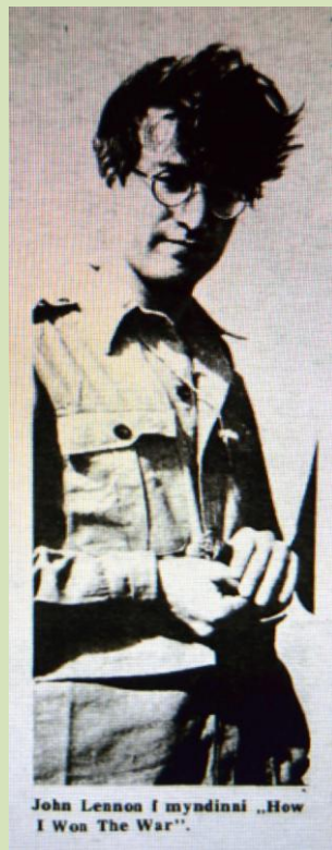
Tíminn 8 október 1978.

2003 réðst Paul McCartney í að endurútgefa LP plötuna og skírði "Let It Be - Naked." Þar sleppir hann nokkrum lögum sem tilheyrðu fyrri útgáfu og bætir öðrum inn í. Var að eigin sögn aldrei fullkomlega sáttur við hana. Og verður maður að taka undir það með honum að þessi sé öflugri. Við hlustun LP hljómplötunnar Le It Be sjáum við að tónsmíðunum hrakar ekki þótt ósætti sé í hópnum. Yfirburðir Bítlanna sem lagahöfunda og flutning eigin tónlistar er enn til staðar. Það sem hins vegar er horfið og kvikmyndin flytur áhorfendum svo vel er leikgleðin og ánægjan af að gera það sem þeir gera. "Þarf ég" - og svo framvegis.