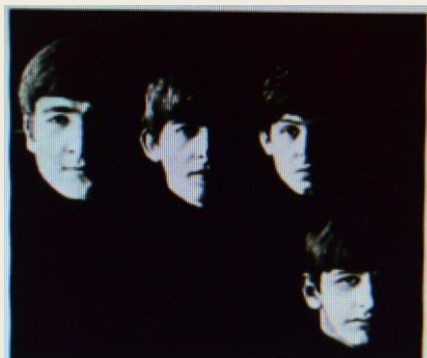
Bítlarnir einokuðu algerlega áratuginn 1960–1970 eins og sjá má á listunum. Það er engum blóðum um það fletta. Bítlarnir eru voru hornsteinn dægurtónlistar.

KONRÁÐ FRÍÐFINNSSON, Blómsturvöllum 1, Neskaupstað. "