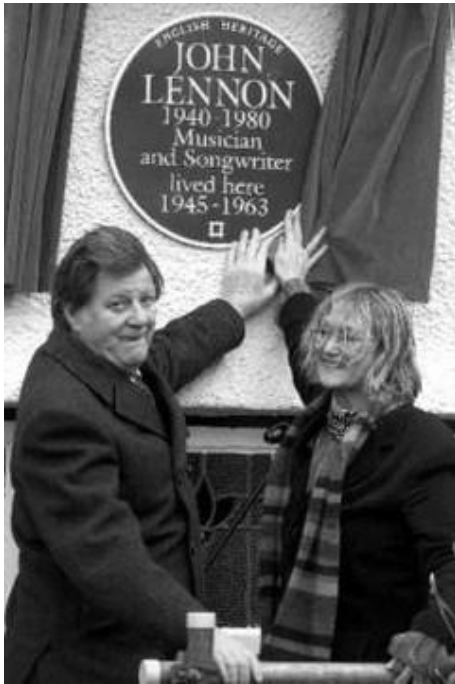
Mynd til vinstri.

Um ári á undan, 8 desember 2000, var afhjúpaður minningarskjöldur á æskuheimili Lennon í Liverpool sem hann kom í eftir að foreldrar hans skildu og Mimi frænka hans tók hann að sér og ól upp og hann bjó hjá til tuttugu og þriggja ára aldurs.