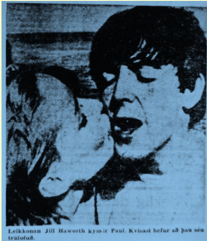
Leikkonan Jill Haworth kyssir Paul. Kvisast hefur að þau séu trúlofuð.

bálskotin í þeim." Önnur kona, ekki lengur á unglingsaldri, dró upp skæri og klippti lokk úr hári Ringos, en hann brást reiður við. The Beatles ræddu í 20 mínútur einslega við sendiherra hjónin, en sendiherrann átti bágt með að toga orð af viti út úr þeim. Hann þekkti þá ekki í sundur og byrjaði á því að spyrja John hvort hann væri John. Hann kvaðst heita Fred, en benti á Georg og sagði: „Þetta er John." Sendiherrann ávarpaði þá Georg og kallaði hann John, en Georg mótmælti og sagðist heita Charlie. Hann benti síðan á Ringo og sagði, að hann væri John. Þannig gekk þetta nokkrum sinnum án þess að sendiherrann fengi rétt svör við spurningum sínum.