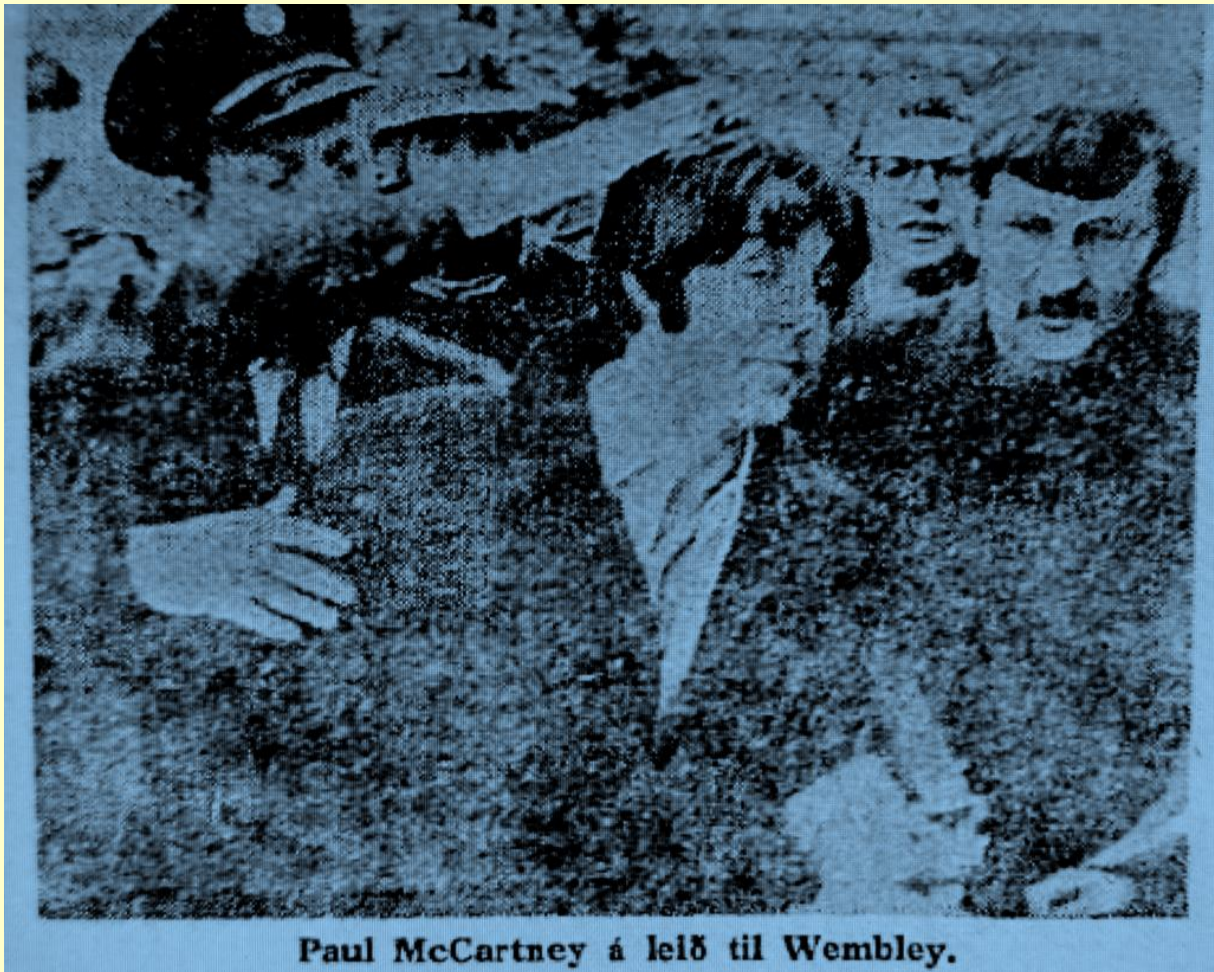
Paul McCartney á leið til Wembley.

Það er ekki tekið út með sældinni að vera heimsfrægur og umsetinn aðdáendum, í að þarf sterk bein til að þola slíkt. Frægustu skemmtikraftar, sem nú eru uppi hafa fengið að kenna á þessu f ríkum mæli. Bítlnarnir gengu meira að segja svo langt, að þeir yfirgáfu aðdáendur sína og héldu til Himalayafjalla til að setjast við fætur Mahesh jóga, heilags manns, sem forðum tíð prédikaði fyrir íslenskum lýð í Stjörnuvísi, þótt hann ku ekki hafa gert sérstaka lukku.