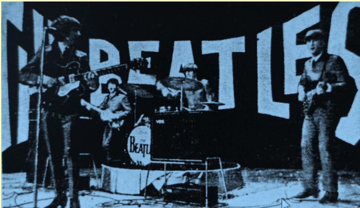
The Beatles árið 1964.

„Við getum ekkert sungið, við getum bókstaflega ekki neitt“. segir George og Paul bætir við „en við skemmtum okkur konunglega“. Verið getur, að Paul hafi þarna hitt naglann á höfuðið og ánægjan og lífsfjórið, sem skín út úr unglíngunum fjórum hefji þá yfir aðra hæfileikalaus söngvara, er eiga frama sinn aðeins að þakka dugandi umboðsmanni. The Beatles hafa haldið hljómleika í mörgum ríkjum Bandaríkjanna og hvar sem þessir síðhærðu fjórmenningar stíga á svið, ætlar allt um koll að keyra. Áheyrendur, sem eru flestir unglíngar, stúlkur í meirihluta, hefja þegar óp og hrifningaröskur og sagt er, að það eina af tónlist The Beatles, sem yfirgnæfi áheyrendur séu trumbuslög Ringos. Æstustu áheyrendur The Beatles standa upp í sætum sínum og stappa, stúlkur gráta af hrifningu, sumir reyta hár sitt, aðrir vaggja sér og stara fram fyrir sig eins og dáleiddir. Unglíngarnir segjast ekki þurfa að hlusta á textann, sem The Beatles syngja, kunni þeir utanað. Aðalatriðið sé að æpa.