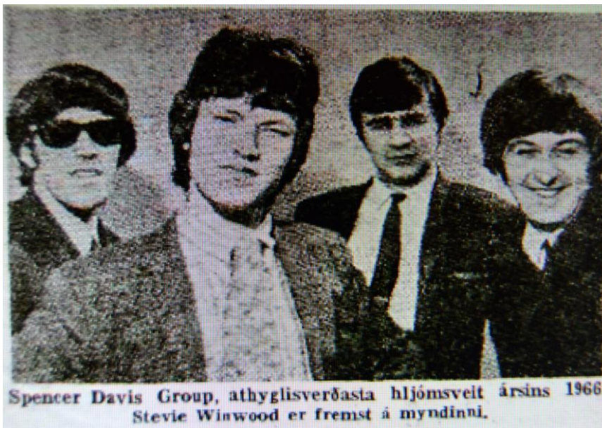
Spencer Davis Group, athyglisverðasta hljómsveit ársins 1966. Stevie Winwood er fremst á myndinni.

Allir vita með hve miklum glæsileika Bítlarnir komu inn á sviðið í byrjun áratugarins og hvernig þeim óx fiskur um hrygg uns hámarki var náð og niðurferðin hófst hjá þeim sem þó náði aldrei alveg niður til botnsins heldur stoppaði einhverstaðar á leiðinni og reis aftur síðar meir og til hæstu hæða og bara er þar, eins og dæmin mörg sanna og fáir sem þræta fyrir að sé. Þeir með Rolling Stones og fleirum sem þá voru og hétu breyttu öllu tónlistarlífi á áratugnum sem um er rætt. Þá ruddi sér líka ný tíska til rúms, og viðhorf ungs fólks til umhverfisins tók smá saman breytingum og er má segja enn við líði og hægt er að sjá í gríðarlegri umhverfisverndinni sem menn geta svo sem haft hvaða skoðanir á sem þeir vilja en á samt rætur að rekja til þess tíma. Í lok ársins 1965 höfðu Bítlarnir unnið alla þá titla og verðlaun sem mögulegt var á þessum vettvangi og ekki bara vegna þess að vera The Beatles heldur frekar hversu góðir tónlistarmenn þeir eru. The Rolling Stones fylgdu fast á hæla Bítlanna á þessum tíma og má segja um árið 1965 að aldrei hafi Rollingarnir veitt þeim harðari samkeppni heldur en það ár og verið við það að fara fram úr þeim í vinsældum. Talsverð keppni var þarna á milli þó minnst væru hún og engin milli þessara hljómsveitar meðlima sem slíkra heldur gilti alfarið hjá aðdáendum sveitanna hér og þar í heiminum. Árið 1965 er Bítlaæðið á algleymingi og öll hugsun ungra meira og minna tengd því.