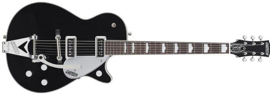
Mynd til vinstri. Gítarinn telur höfundur að sé eign Georg Harrison.