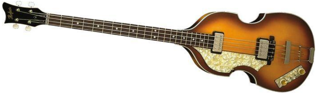
Gítar eins og John Lennon spilaði á upp á þaki Apple- byggingarinnar 1969 og frægt varð.